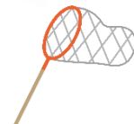
違う遊びをしていた子も興味津々で覗きに来ていました！