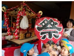
四丁町のうちわを持ったを思い出したのかな？

ひまわり組さんと一緒に四丁町コミュニティーセンターへお神輿を見に行った際にひまわりさんはお神輿を作るという話になりました。「きく組はどうですか？」と問いかけたところ「ひまわりさん応援する」「頑張りたい」という声が上がってきました。「後ろから応援するん？」と聞くと「うちわ持ってる！」という意見に「それがいい」とみんな大賛成し、みんなで個人個人のうちわを制作することになりました。夏祭りまでには思い思いの可愛いうちわが出来かなと思います。きくさんの応援したいという気持ちを大事にしながら夏祭り当日はひまわりさんの応援団として精一杯声を出していけたらなと思っています。