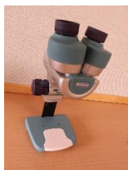
月津こども園にある顕微鏡「ファール」を使って虫を見ました！