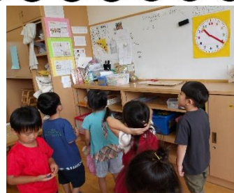
お片付けになったよ～

6/10 は時の記念日ということできく組では「時間を大切にしようね」などのお話をした後「時間や数字などに少しでも興味を持ってくれたらいいな」という思いから、保育教諭が時計を作り片付け時間や食事の時間など視覚的に分かりやすく伝えていっています。子ども達も手作りの時計と本物時計とを見比べながら「お片付けや！」「もうちょっとでご飯や」と言って過ごしています。