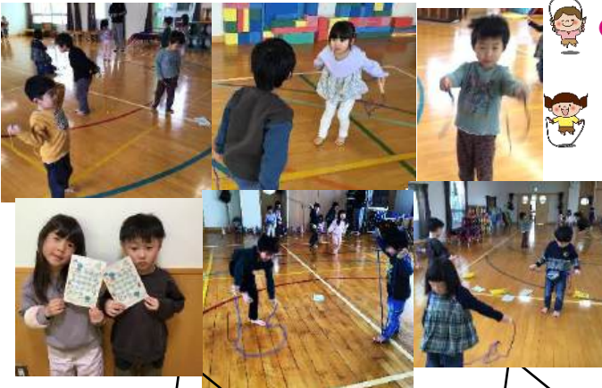
目標は20回! 頑張るぞ~!!

きく組では縄跳びに興味を持ち始め、跳ぼうと頑張っています。そこで子たちに「ちょっと頑張ってみようかな」という気持ちを持って欲しくて「縄跳びカード」を作ってみました。「20回跳べたらやね〜。」と伝えると「え〜!?20回?そんな跳べん!」「5回なら跳べる」などの声が寄せられました。「1回でも2回でもいいよ。練習すると跳べるようになるよ。いっぱい跳べるようにみんなで頑張ろ〜!」と励まし挑戦出来るように声かけしました。遊戯室に行くと「縄跳びしていい?」と自分から縄跳びに挑戦している姿もあり、縄跳びカードに〇が付くと嬉しそうな笑顔も見られ、自分のやりたい事に向かって繰り返し挑戦したりする事で向上心も生まれます。また繰り返し取り組む事で「出来た」という喜びを味わい満足感や達成感となり諦めずにやり遂げる事で自信にも繋がっていきます。12月の通信でもお知らせしましたが、子ども達の跳びやすい縄跳びならどんなものでも大丈夫ですので、園に1つ持たせてください。