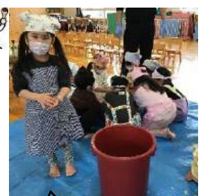
おいしくなりますように