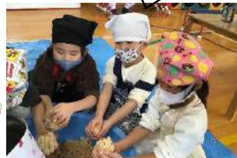
大豆から味噌が出来る事を学びました。